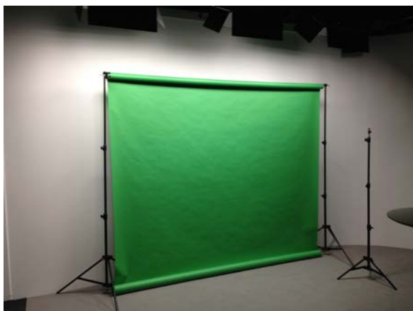
Un fond vert ou noir amovible permet de réaliser des tournages pour incrustation.

Le studio, structure ouverte à de multiples usages et utilisateurs, est modulable. L'utilisateur peut opter pour tout ou partie des locaux et équipements disponibles, voir le tarif pour les différentes options. L'ensemble de la structure a été conçu pour permettre une reconfiguration rapide afin d'enchaîner des projets aux besoins variés.